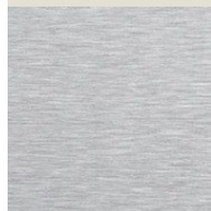
CNS aussen geschliffen