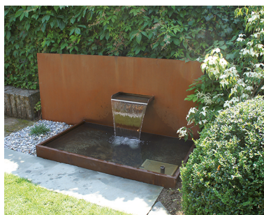
Alta Marea 21801