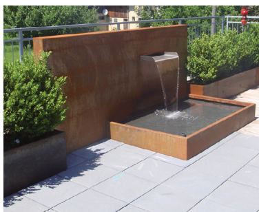
Alta Marea mit 150mm breitem Körper hinten