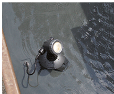
LED Spot 5W schwarz als Beleuchtung